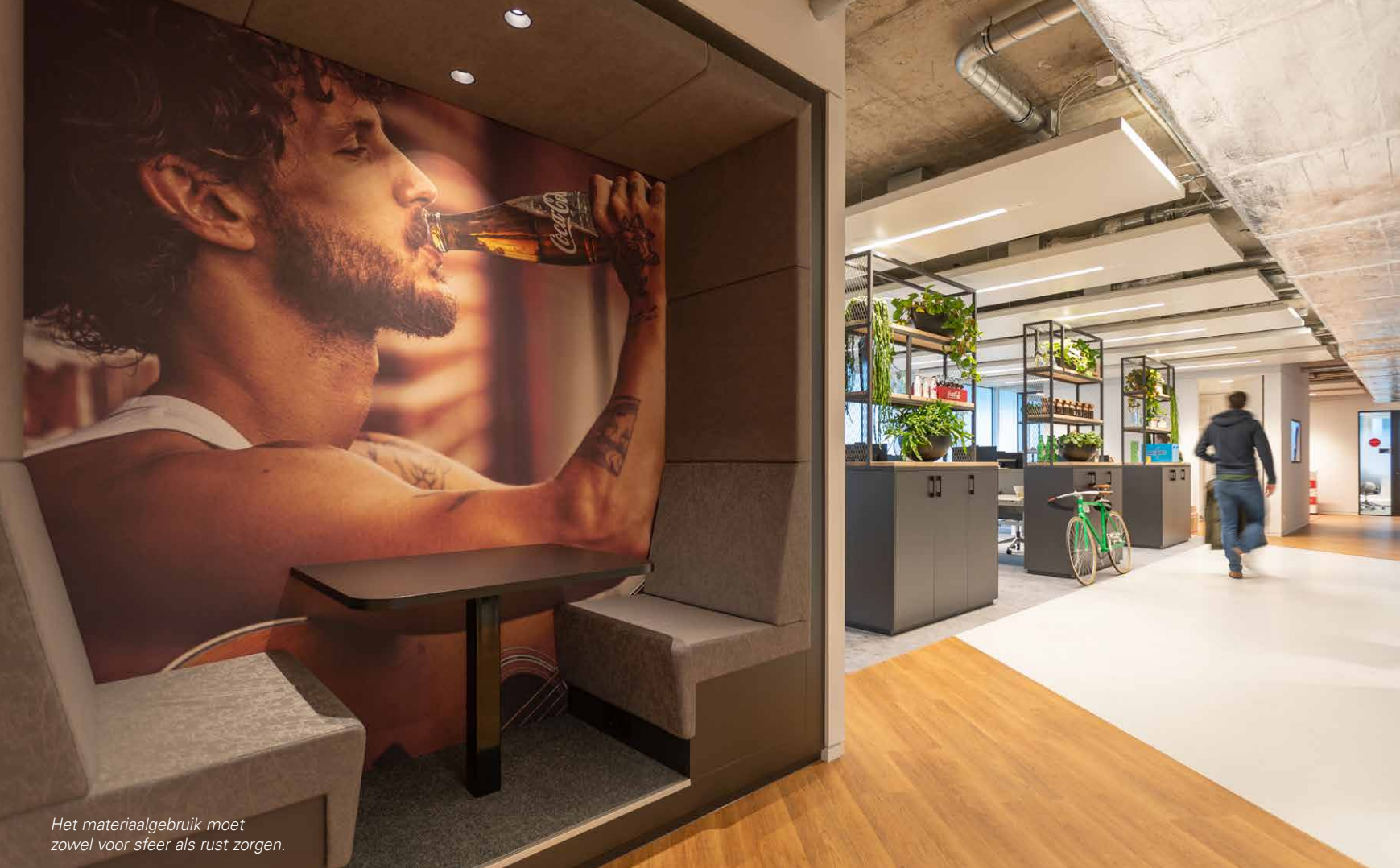
Het materiaalgebruik moet zowel voor sfeer als rust zorgen.